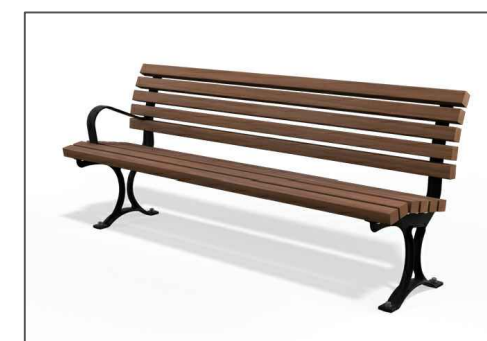
פרט 7.1 - ספסל אילון עם משענת מק"ט 1002 תוצרת שחם אריכא או ש"ע