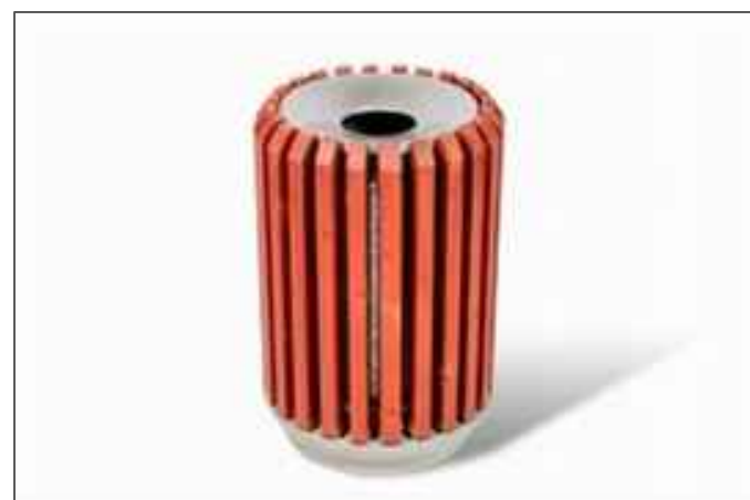
פרט 7.2 - אשפתון תמר מק"ט 1428 תוצרת שחם אריכא או ש"ע